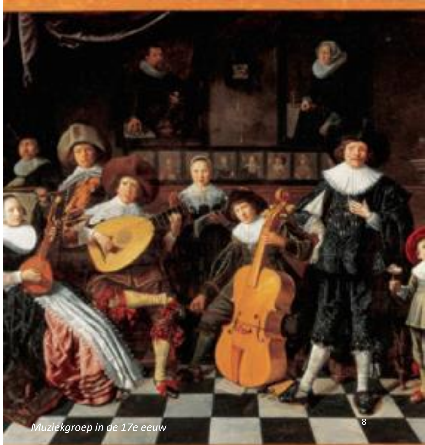
Muziekgroep in de 17e eeuw

Madrigalen bestonden al in de veertiende eeuw, maar waren oorspronkelijk eenvoudige twee- of driestemmige herdersliederen met een refrein. Maar in de vijftiende eeuw ontwikkelde zich in Italië een modernere vorm. Componisten kregen langzamerhand genoeg van de eenvoudige, soms boertige teksten van deze liederen. Ze waren veel meer geïnteresseerd in de serieuze poëzie van opkomende dichters als Petrarca en zijn navolgers over liefde, verdriet, dood en andere existentiële thema's uit de Renaissance. Componisten begonnen voor het madrigaal polyfone muziek te schrijven met meer melodische en harmonische mogelijkheden en vaak zeer gedurfde chromatiek.