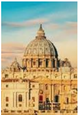
Sint Pieter - Rome

De ‘prins van de muziek’ werd hij in zijn hoogtijdagen genoemd. Zijn zangplek werd het Maria Maggiore in Rome. Rond 1550 promoveerde hij tot kapel-meester en organist van de kathedraal van zijn geboorteplaats Palestrina. In 1555 had hij de hoogste positie bereikt: een baan in de Sint Pieter en in de pauselijke Sixtijnse kapel.