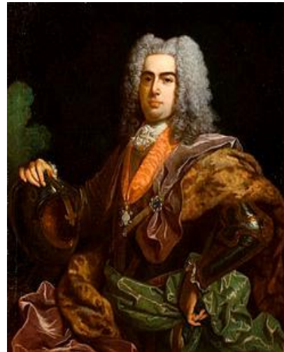
Koning João V van Portugal

... brachten hun muziek en hun manier van uitvoeren mee. Het Portugese maniërisme van Renaissance-oorsprong werd bijna geheel vervangen door een stijl met een eenvoudiger contrapunt, modernere kleuren en gebaseerd op het gebruik van basso continuo.