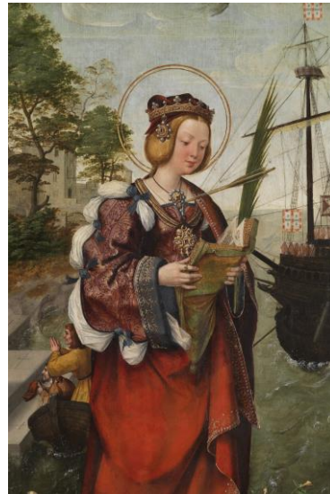
Afaart van de relikwieën van St Auta uit Keulen - Christovão de Figueiredo

(1566-1650) was een van de belangrijkste componisten die in de oude, rijke Portugese stijl componeerde. Cardoso studeerde in de stad Évora, een belangrijk